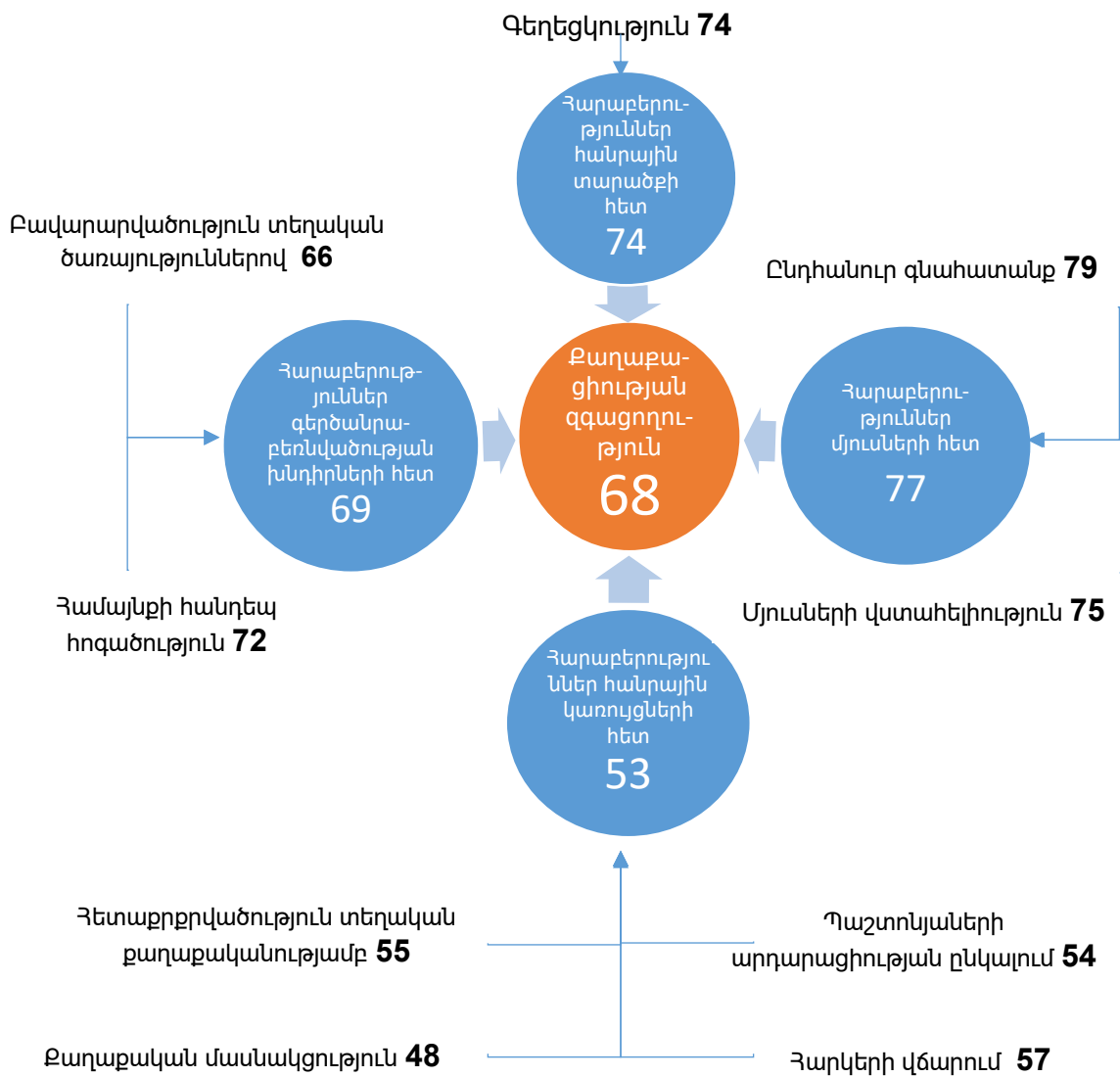
Գծապատկեր 5՝ Քաղաքացիության ինդեքսի գնահատականը