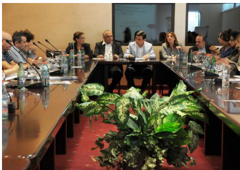
Դաշինքի հանդիպումը կառավարության ներկայացուցիչների հետ

մենակ «cooperative advocacy»-ն [շահերի պաշտպանության համագործակցային մոտեցումը] է աշխատում, ուրիշ բան Հայաստանում չի աշխատում: Քննադատությունը, դեկլարատիվ բնույթի աշխատանքները չեն աշխատում, ինքը ուղղակի քեզ չի լսում, վերջացավ: Պիտի նրա [պետության] հետ աշխատես, նրա գործի կեսը անես, նրա ուզած փաստաթուղթը գրես...» (Դաշինքի անդամ ՀԿ-ի ներկայացուցիչ):