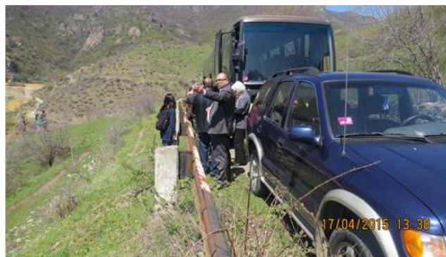
Լրատվամիջոցների այցը Մեծ Այրում

Քարոզարշավի հիմնական համագործակիցները տարբեր ոլորտներում աշխատող ՔՀԿ-ներն էին: