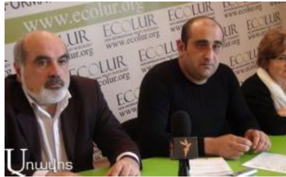
Մամուլի ասուլիս Էկոլուր մամուլի ակումբում

վստահ լինել: Ինչ ուզում, այն էլ անում են» (Մեծ Այրումի բնակիչ): Օրիուս կենտրոնի ներկայացուցիչը հաստատում է, որ Ախթալա հանքարդյունաբերական ձեռնարկության գործարկած ոչ մի պոչամբար չի համապատասխանում անվտանգության նորմերին. «Հիմնարկը շահագործում է 3 պոչամբար, երեքն էլ անմխիթար վիճակում են, բազմիցս ահազանգել ենք»: