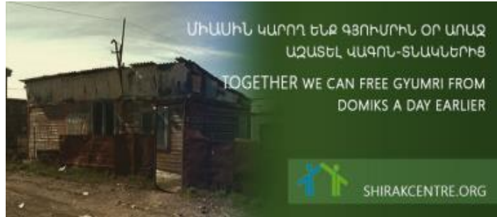
Տնակային կացարանի լուսանկարը և ծրագրի կոչը

կարգավորում է պետք» («Շիրակ կենտրոն» ՀԿ-ի ղեկավար): Այս առաջարկները հիմնականում ընդունվել են համապատասխան որոշում կայացնողների կողմից, սակայն որոշակի փոփոխություններով: