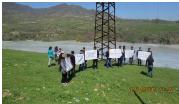
Երիտասարդները լրագրողներին դիմավորում են «Ո՛չ Նահատակ պոչամբարին» պլակատներով

Քարոզարշավի առավել նշանակալի մարտահրավերներից էր տեղական իշխանություններին ընդդիմանալը: ՏԻՄ ներկայացուցիչները այնքան էլ ցանկալի չեն համարում գյուղում պոչամբար ունենալ. « Դա ուղղակի ծիծաղելի է, ով կուզի որ իր տան