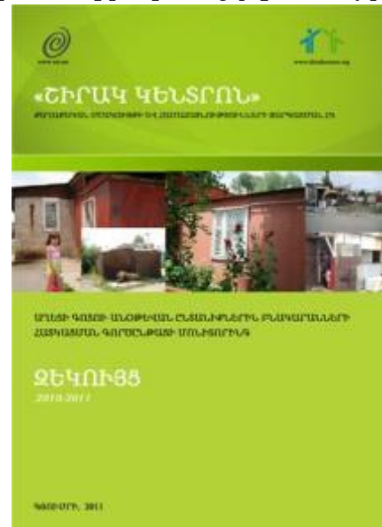
Բնակարանների հատկացման գործընթացի մոնիթորինգի զեկույցի շապիկը

Քարոզարշավի նախնական փուլում կազմակերպությունը ֆինանսական ռեսուրսների ներգրավման համար համագործակցել է մի քանի միջազգային կազմակերպությունների հետ, ինչպես օրինակ Քաունթերփարթ Ինթերնեշնլը և Բաց հասարակության հիմնադրամը: Քարոզարշավի նախնական պլանավորումն իրականացվել է այդ կառույցներին ներկայացված ծրագրերի շրջանակներում: Հետագա պլանավորման ժամանակ կազմակերպությունն օգտագործել է ուղեղային գրոհը՝ որպես գործունեության նպատակներն ու միջոցները հասկանալու արդյունավետ գործիք: Ինչպես նշեց պարոն Թումասյանը. «Մշխատում ենք գրել շատ, բայց անել տասնապատիկը: ... Մարդկանց ճակատագրերի հետ ես առնչվում և պետք է ամեն ինչ անես: Վերջապես, քեզանից է կախված՝ երեխան դպրոց կգնա, թե չէ...»: