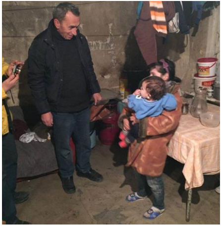
«Շիրակ կենտրոն» ՀԿ նախագահը շահառու ընտանիք այցի ժամանակ

Քարոզարշավի հաջողությունն առաջին հերթին պայմանավորված է մանրամասն և համապարփակ տեղեկատվության առկայությամբ: Կազմակերպության աշխատակիցները մանրամասն ճանաչում են յուրաքանչյուր շահառուին՝ ընտանիքի ողջ պատմությամբ, խնդիրներով և հնարավորություններով: Ինչպես նշում է կազմակերպության ղեկավարը. «Շատերն են այս ծրագրերը վերցնում և իրականացնում, և ՏԻՄ-ը, և շատ միջազգային կազմակերպություններ, սակայն մեզ չեն կարող փոխարինել, քանզի այդ ահռելի ինֆորմացիոն բազան երևի միայն մենք ունենք: Եվ հարցը ամենևին նրանում չէ, որ այդ տեղեկատվությունը ինստիտուցիոնալիզացված չէ կամ էլ գաղտնի է, պարզապես ավելին քան 8 տարիների ամենօրյա աշխատանքի արդյունքում կուտակված տեղեկատվությունը հնարավոր չէ փոխանցել»: Կազմակերպության ղեկավարի փորձը և փորձագիտությունը հատկապես կարևոր նշանակություն ունեն. «Ինքը շատ լավ տիրապետում է աղետի գոտու հիմնահարցերին, տարբեր սոցիալական շերտերի և մարդկանց հիմնախնդիրներին և... ինքը կոնկրետ լուծումներ է առաջարկում: Ընդ որում իր առաջարկած լուծումները հիմնված են տարիների ընթացքում կատարած հետազոտությունների, ուսումնասիրությունների վրա, դա նաև մեզ համար է նպաստավոր» (ՀՀ քաղաքաշինության նախարարության ներկայացուցիչ): Այս մեջբերումը ցույց է տալիս նաև կոնկրետ, պրակտիկ լուծումներ առաջարկելու կարևորությունը: