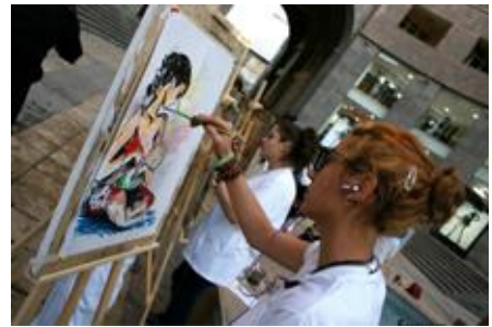
Կրծքով կերակրման խթանման ֆելշ-մոբ