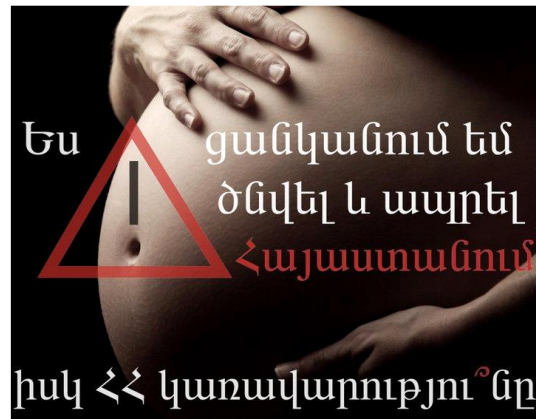
Նախաձեռնության պլակատներից մեկը

մեծամասնության համար մայրության արձակուրդի ընթացքում ստացած նպաստի չափն ամբողջությամբ պահպանվեց: Մա կարևոր ձեռքբերում էր կանանց իրավունքների պաշտպանության տեսակետից, քանի որ կանայք այլևս կարող են փոխել իրենց աշխատանքը առանց երեխա ունենալու դեպքում եկամուտը կորցնելու ռիսկի, իսկ աշխատող կանանց մեծամասնությունը մայրության արձակուրդի դեպքում աշխատավարձին հավասար փոխհատուցում կստանա և երեխա ունենալու պատճառով եկամտի կորուստ չի ունենա (առնվազն օրենքով սահմանված ժամանակահատվածի, այսինքն՝ 140 օրվա ընթացքում):