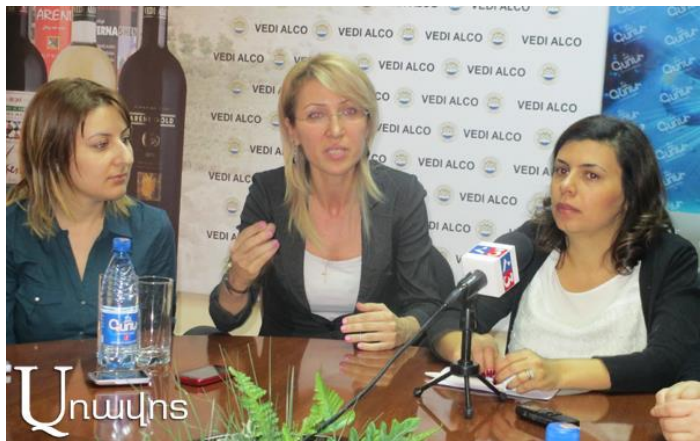
Նախաձեռնության անդամներն իրենց մտահոգություններն են ներկայացնում մամուլի ասուլիսին