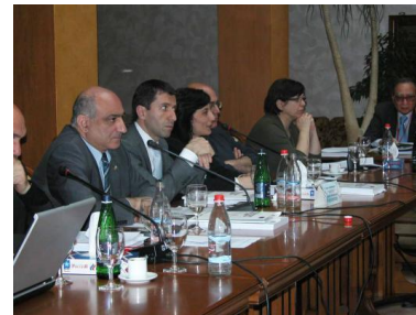
ՏՎԽ հիմնախիռ հանդիպում՝ ՏՎԽ անդամները ՄԲ պաշտպանի հետ

2010թ. Հայաստանում մի շարք օրենսդրական փոփոխություններ ընդունվեցին զրպարտության և վիրավորանքի ապաքրեականացման վերաբերյալ, որն առաջընթաց էր խոսքի ազատության պաշտպանության առումով: Միևնույն ժամանակ, վիրավորանքի ապաքրեականացման արդյունքում լրատվական ընկերությունների դեմ մեծ քանակով դատական հայցեր ներկայացվեցին: Դատարանները ստիպված էին գործ ունենալ նոր իրավական հասկացությունների հետ փորձելով հավասարակշռություն պահպանել խոսքի ազատության և մասնավոր կյանքի գաղտնիության ու անձի արժանապատվության իրավունքների միջև, ինչը