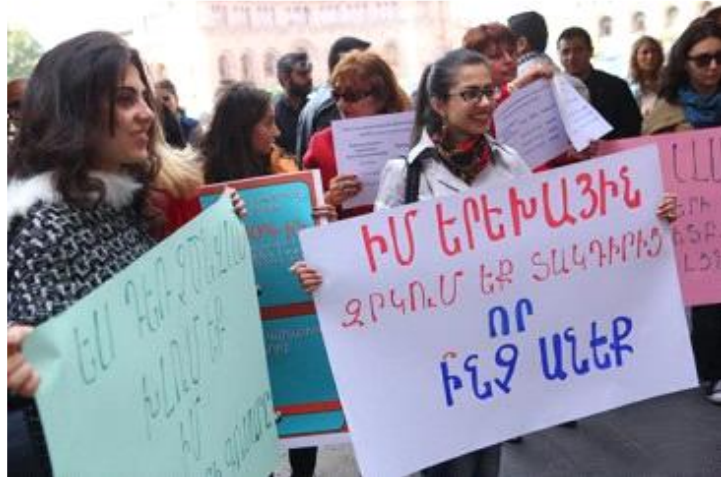
Կանայք բողոքում են կառավարության շենքի մոտ

Նախաձեռնության հիմնական անդամներն իրենց իրավաբանական ու հաշվապահական փորձագիտության շնորհիվ պահանջների հիմնավորումներն էին մշակում, իսկ լրատվամիջոցների հետ առնչությունն ունեցող մասնակիցներն ապահովում էին լրատվամիջոցների ներգրավումը, որը հատկապես կարևոր էր շարժման սկզբում: Նամակների ու ստորագրահավաքների համար հիմնականում օգտագործվել են համացանցի ռեսուրսները, մինչդեռ քարոզարշավի միակ նյութական ռեսուրսը պլակատները, տպում կամ ձեռքով պատրաստում էին հենց մասնակիցները: